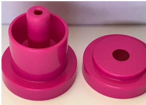
ベースおよびキャップ ポリプロピレン